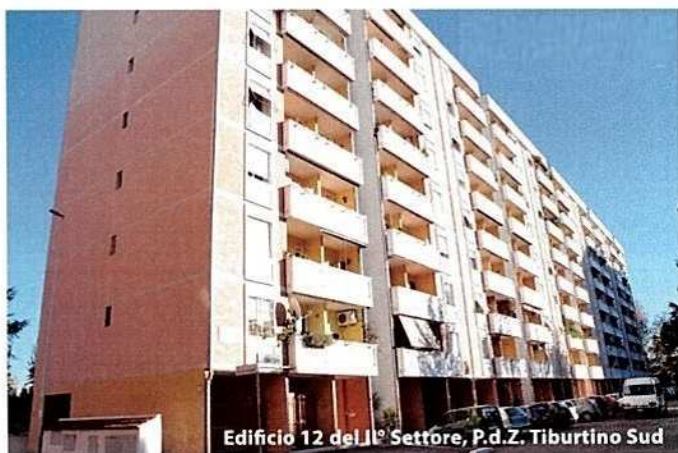
Edificio 12 del 11° Settore, P.d.Z. Tiburtino Sud